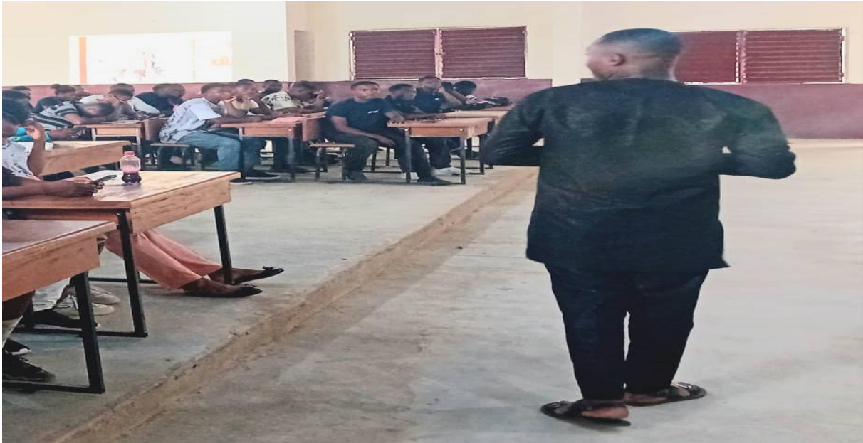
PHOTO DE Dr ANTONY STEPHEN, EXPERT DE PROMESSDUR EN SALLE PENDANT LA SEANCE DE SENSIBILISATION DES ETUDIANT DE LA FACULTE DES SCIENCES DE L'UNIVERSITE D'EBOLOWA, ANNEXE DE MONATELE