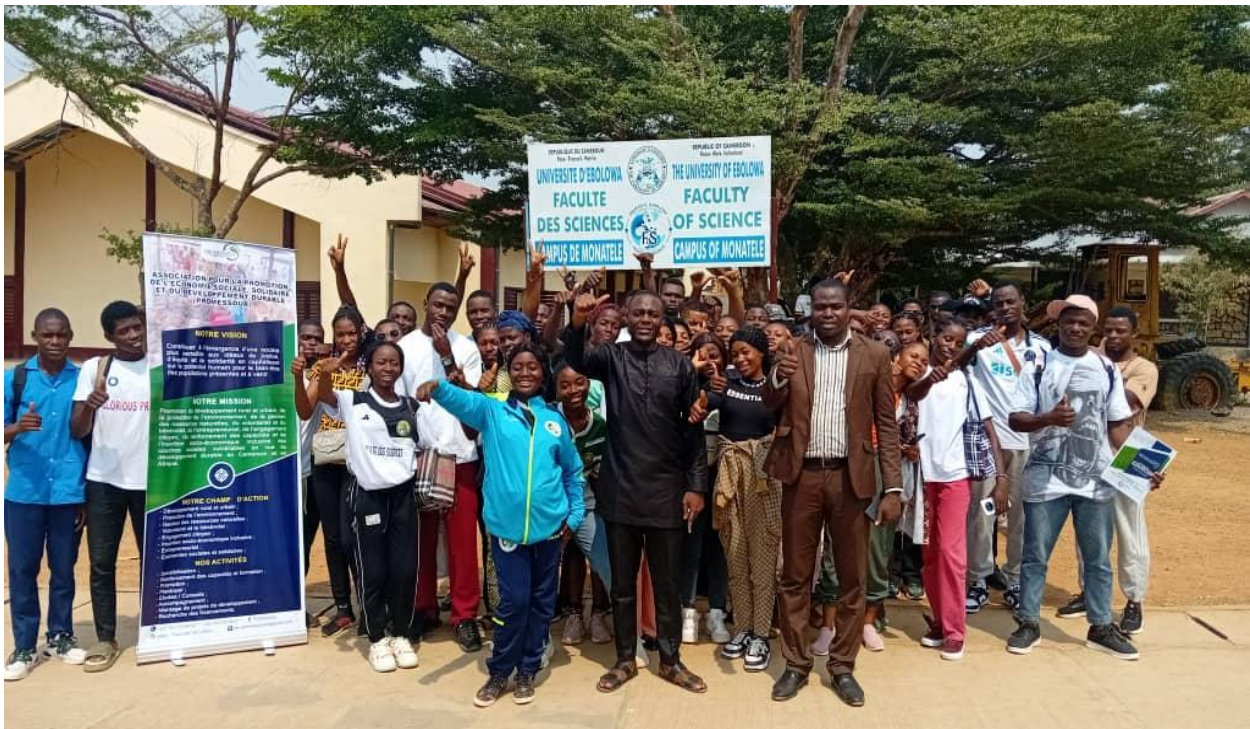
PHOTO DE FAMILLE APRES LA SENSIBILISATION DES ETUDIANTS DE LA FACULTE DES SCIENCES DE L'UNIVEVERSITE D'EBOLOWA, ANNEXE DE MONATELE

Le présent rapport rend compte de cette activité, tant sur le plan de son organisation que de son déroulement.